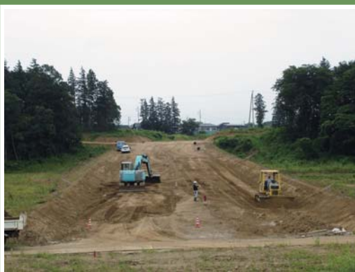
③谷田部萱丸線の道路工事の様子