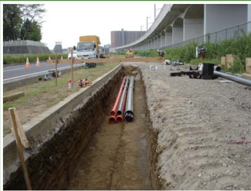
②新都市中央通線の電線共同溝工事の様子