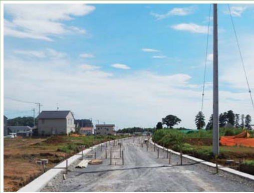
①区画道路工事の様子

平成25年度は、造成工事や道路工事等を予定しております。 工事箇所周辺の皆様にはご迷惑をおかけしますが、ご協力をよろしくお願いいたします。 なお、工事予定箇所は、今後変更になることがございますので、あらかじめご了承下さい。