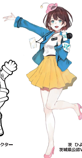
茨 びより 茨城県公認Vtuber