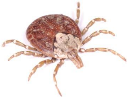
タカサゴキララマダニ（吸血前：約7mm）

マダニに咬まれていることに気が付いた場合、無理に引き抜こうとするとマダニの一部が皮膚内に残って化膿したり、マダニの体液を逆流させてしまったりするおそれがあるので、医療機関（皮膚科など）で処置（マダニの除去、洗浄など）をしてもらってください。また、マダニに咬まれた後、数週間程度は体調の変化に注意をし、発熱等の症状が認められた場合は医療機関で診察を受けてください。