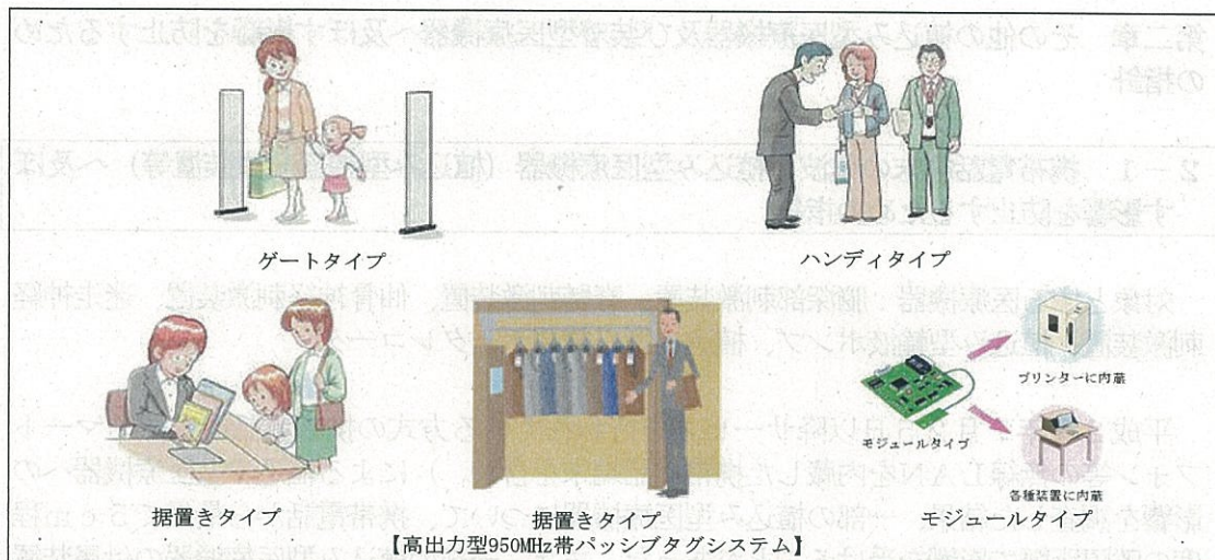
図4 各タイプのRFID機器

注3： 比較的長距離の通信が可能なUHF帯（950MHz帯）の電波を利用するRFID機器。 例えば、コンテナやパレットなどに貼付したタグの一括読み取り等のアプリケーションに使用されることが想定される。