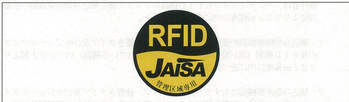
図3 管理区域専用RFID機器用ステッカ

注1：ここでは、公共施設や商業区域などの一般環境下で使用されるRFID機器を対象としており、工場内など一般人が入ることができない管理区域でのみ使用されるRFID機器（管理区域専用RFID機器）については対象外としている。なお、管理区域専用RFID機器については、（一社）日本自動認識システム協会において、一般環境への流出を防止するため、取扱説明書等に注意書きを記載するとともに、管理区域専用RFID機器用ステッカ（図3）を貼付することとされている。