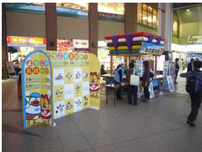
長崎駅総合案内所