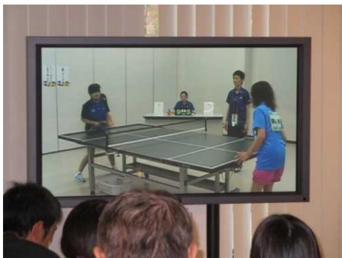
サウンドテーブルテニス