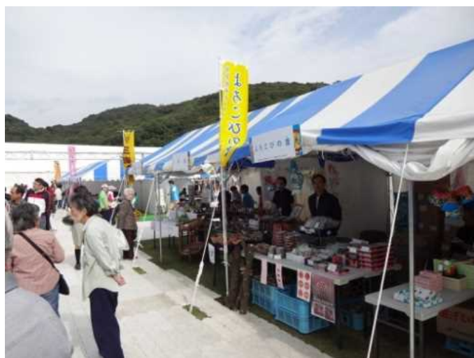
ふれあい広場（物販）