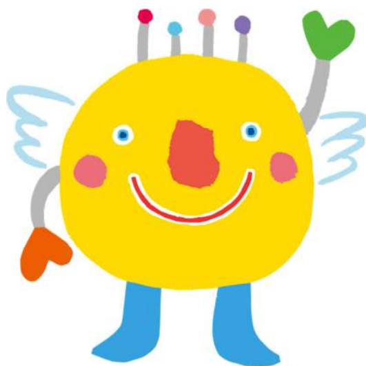
第19回全国障害者スポーツ大会 マスコット「いばラッキー」