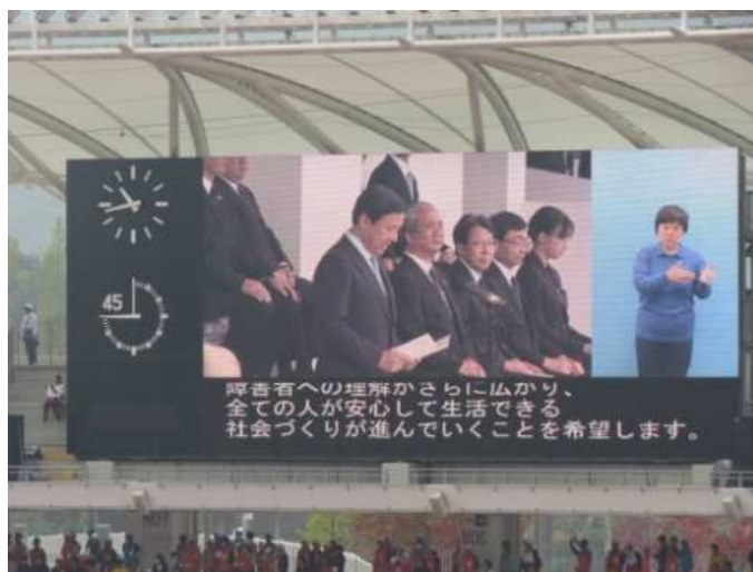
皇太子殿下御臨席