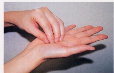
3. 指先、爪の間をよく洗う