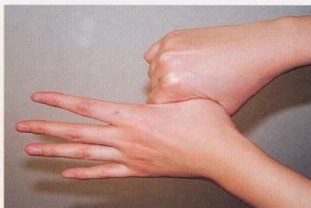
5. 親指と手掌をねじり洗いする