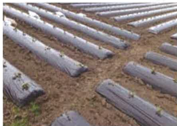
枕畝途中に設置した排水路