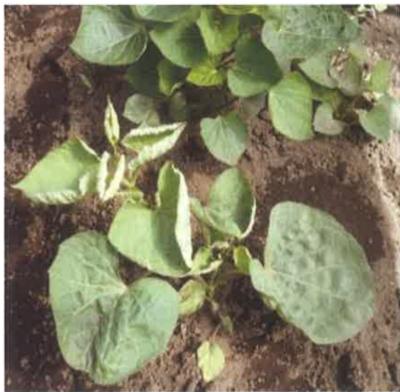
葉巻、株の萎縮症状