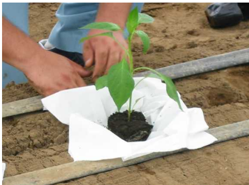
図3 定植作業の様子