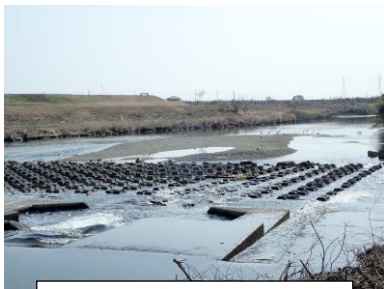
3月9日 久慈川堅磐堰の様子