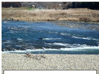
3月9日 那珂川千代橋上流の様子