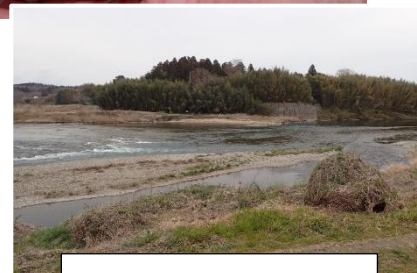
3月26日 那珂川千代橋の様子

連絡先 茨城県水産試験場内水面支場 内水面資源部：0299-55-0324（代）