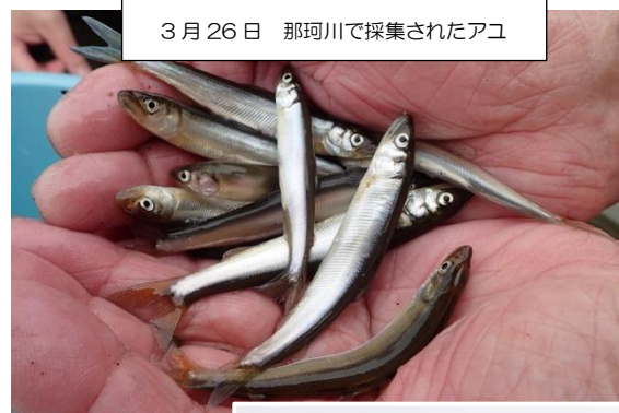
3月26日 那珂川で採集されたアユ