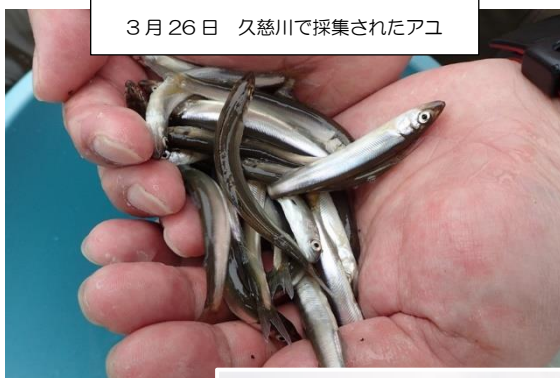
3月26日 久慈川で採集されたアユ