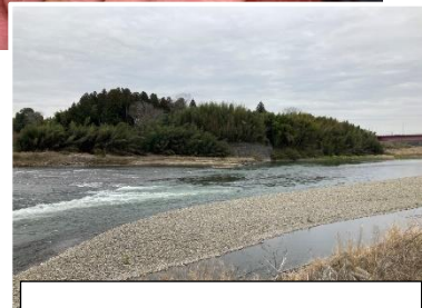
3月29日 那珂川千代橋上流の様子

連絡先 茨城県水産試験場内水面支場 内水面資源部：0299-55-0324 (代)