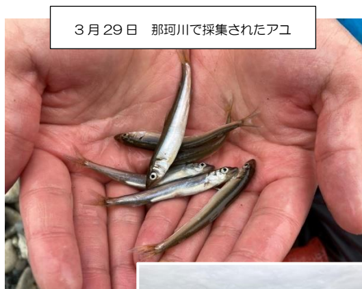
3月29日 那珂川で採集されたアユ