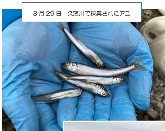
3月29日 久慈川で採集されたアユ