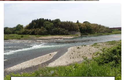
那珂川千代橋上流の様子

連絡先 茨城県水産試験場内水面支場 内水面資源部：0299-55-0324（代）