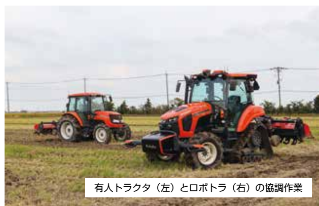
有人トラクタ（左）とロボトラ（右）の協調作業

収益性の高い稲作経営を確立するため、茨城モデル水稲メガファーム事業では担い手への農地の集積・集約化と併せて、ロボット技術やICT等の先端技術の導入を支援しています。