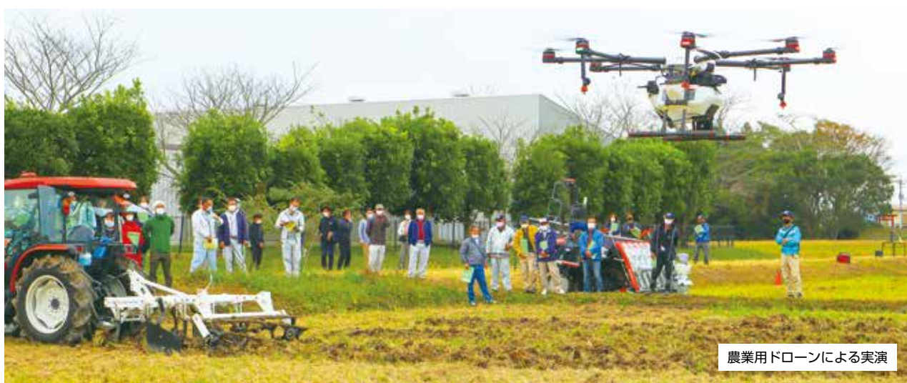
農業用ドローンによる実演