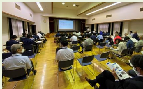
当日の現地検討会の様子