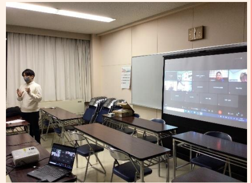
サテライト会場での発表の様子

後継者クラブのさらなる活動活性化に向け、普及センターは引き続き関係機関と連携しながら支援を継続していきます。