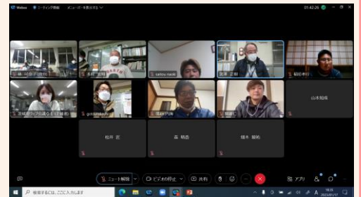
意見交換の様子（パソコン画面）