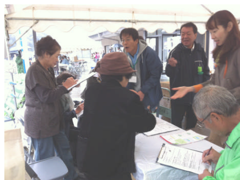
多面的機能の理解促進のため、アンケート調査が実施されました。