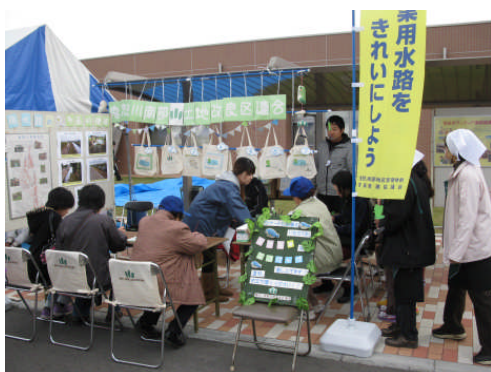
PRグッズの配布やアンケート調査が配布されました。