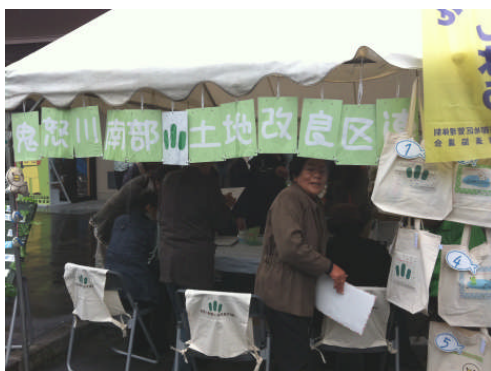
PRグッズとして、エコバッグやクリアファイル・ポケットティッシュなどが配布されました。