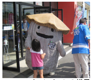
キャンペーンの様子