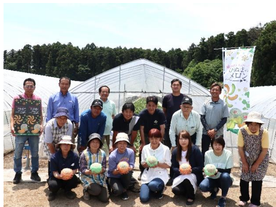
【茨城町メロン写真 左：ひぬまの恵み 愛ちゃん、右：部会員の皆様】