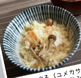
のどぐろ(ユメカサゴ)と きのこの炊き込みご飯