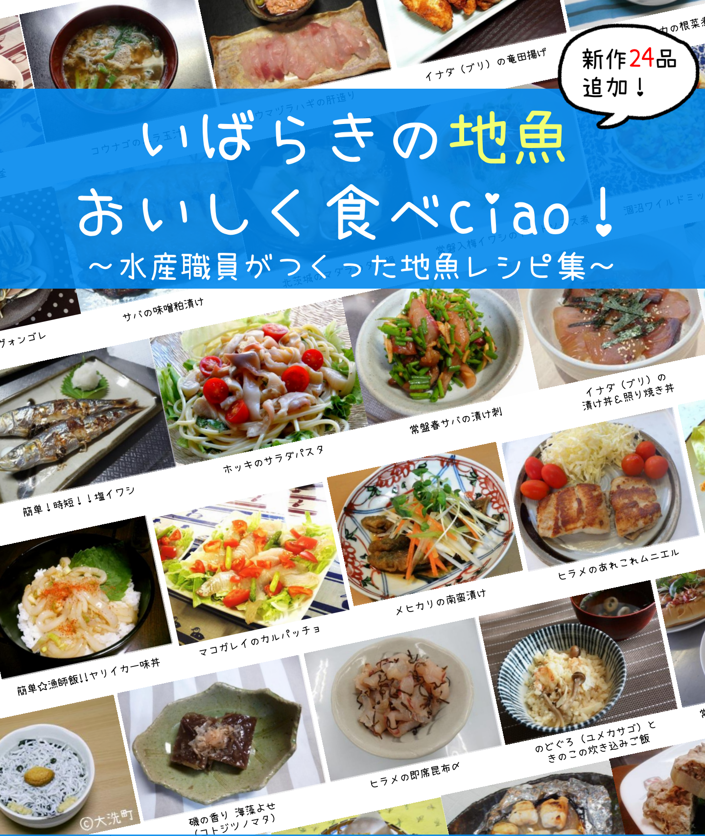
サバの味噌粕漬け