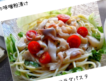
ホッキのサラダパスタ