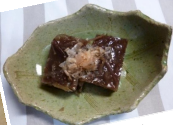
磯の香り 海藻よせ (コトジツノマタ)