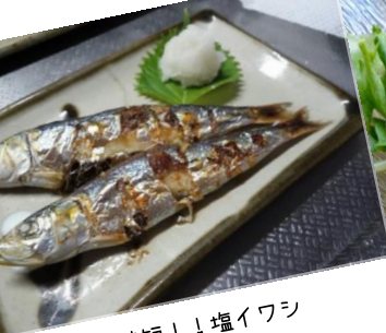
簡単!時短!!塩イワシ