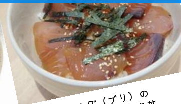
イナダ(ブリ)の 漬け丼&照り焼き丼