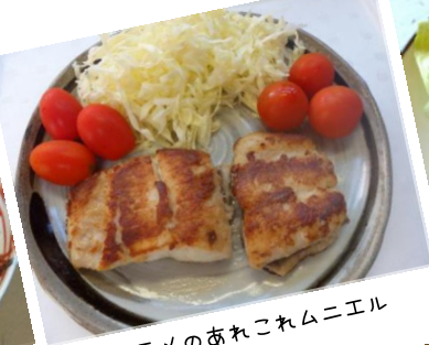
ヒラメのあれこれムニエル