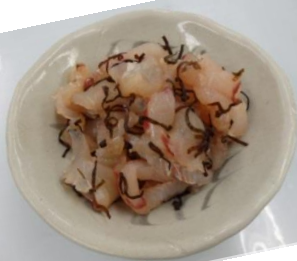
ヒラメの即席昆布〆