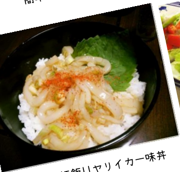
簡単☆漁師飯!!ヤリイカー味丼