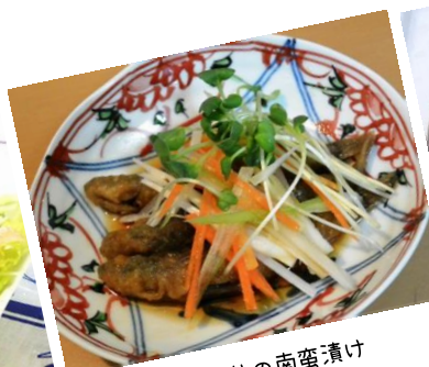
メヒカリの南蛮漬け