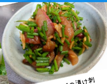
常盤春サバの漬け刺