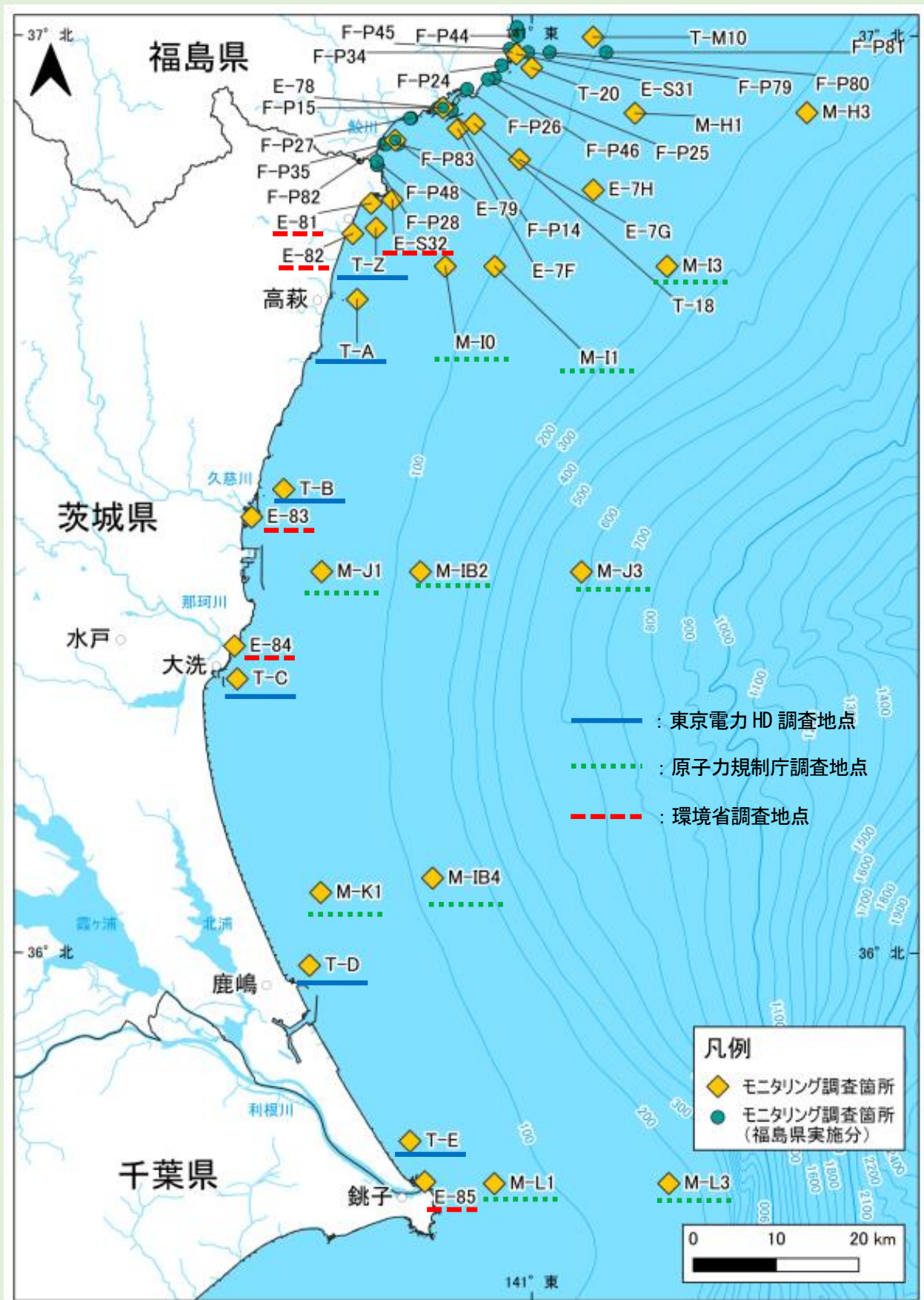
図Ⅱ-2 茨城県沖合の海域モニタリング地点 (海域モニタリングの進め方)