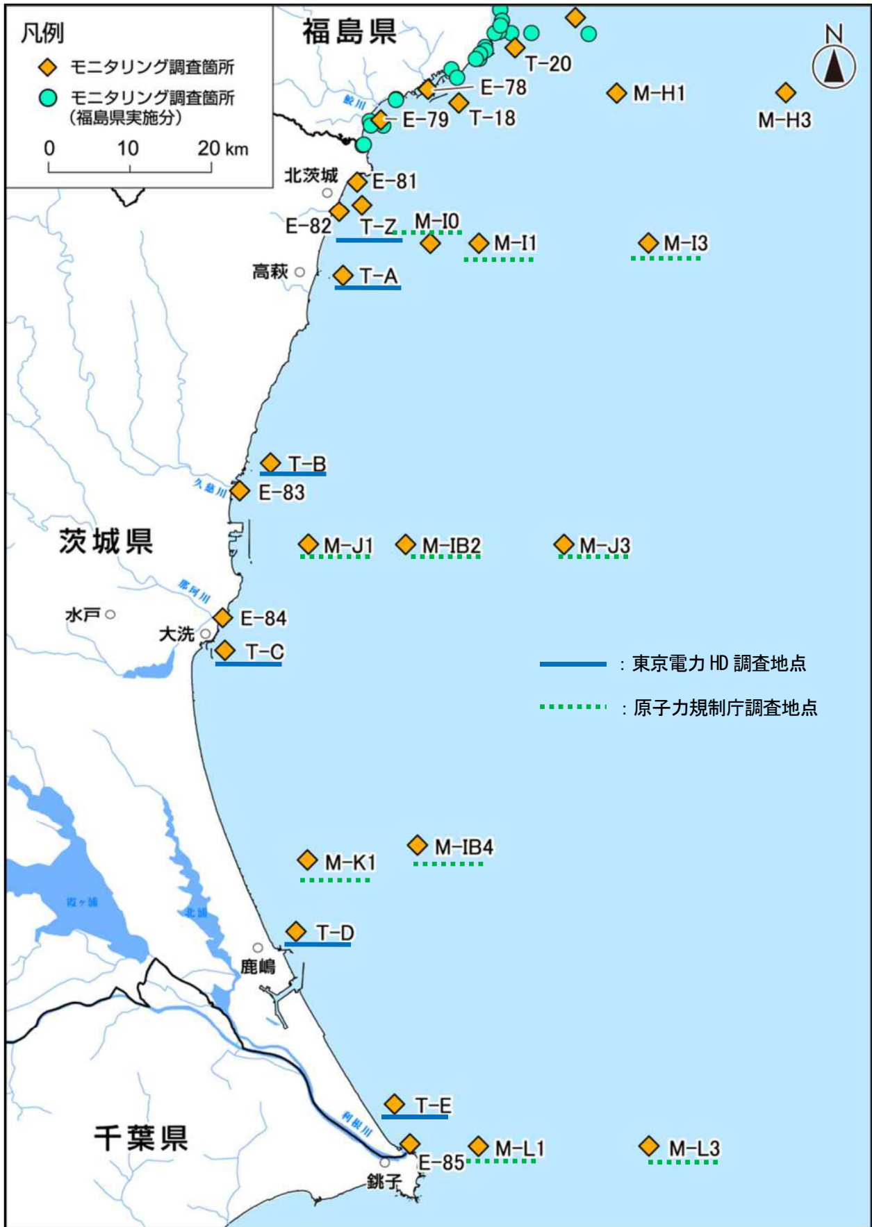
図Ⅱ-2 茨城県沖合の海域モニタリング地点 (海域モニタリングの進め方)