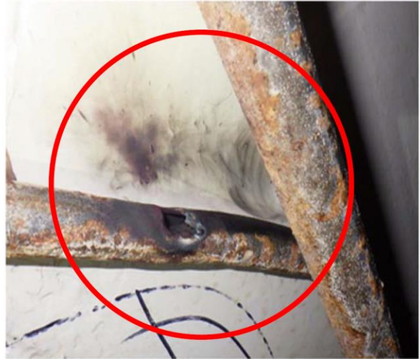
左図拡大図：電線管に穴を確認