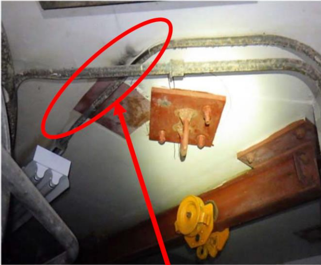
当該赤枠部分に 焦げ跡を確認