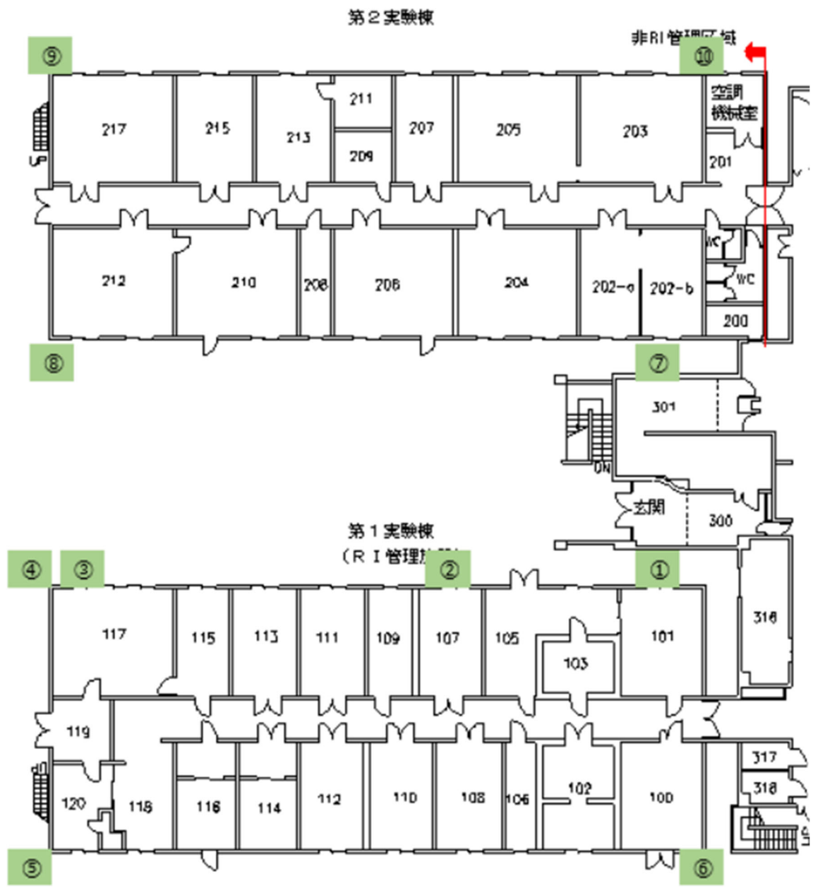
添付 4-2 屋外土壌表面の表面密度測定結果（測定場所）