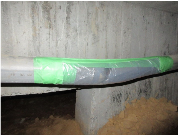
破断箇所 A 養生後 (2022年8月4日実施)