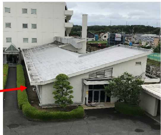
第一実験棟外観写真