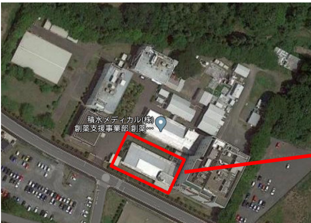
創薬支援センター 全体写真