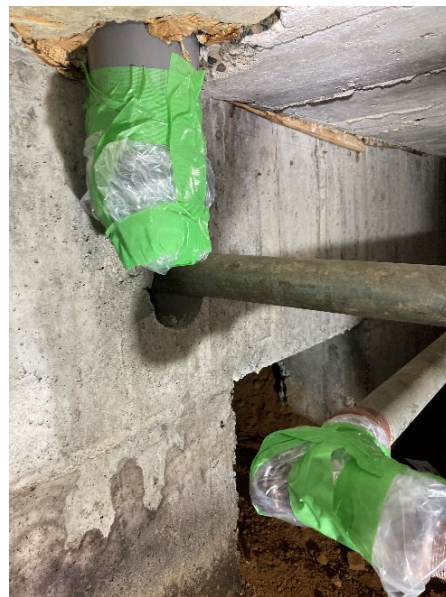
脱落箇所 B 養生後 (2022年8月8日実施)