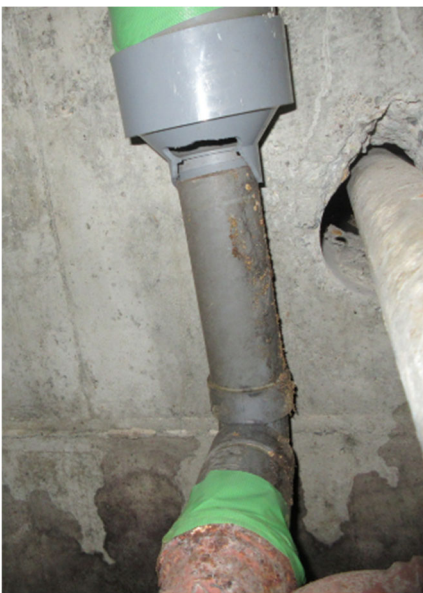
脱落箇所 B 仮養生後 (2022年8月4日実施)