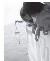
霞ヶ浦湖上体験スクール