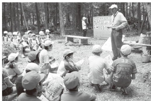
子どもたちへの森林環境教育

県民の皆さんに森林の大切さや木の良さを理解していただき、「県民全体で森林を守り育てていこう」という意識の醸成を図ることができました。