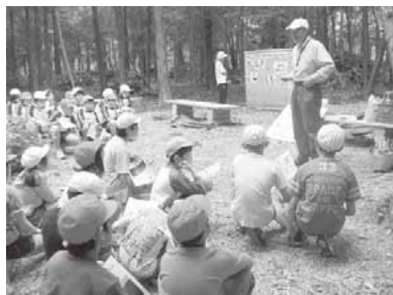
子どもたちへの森林環境教育

このほか、霞ヶ浦・北浦水質保全市民活動支援事業及び霞ヶ浦環境体験学習推進事業により、県民全体の水環境保全意識の醸成を図ることができた。