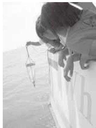
霞ヶ浦湖上体験スクール

また、生活排水を未処理のまま放流している単独処理浄化槽から合併処理浄化槽への転換を促進するため、単独処理浄化槽の撤去費用について補助を行った。