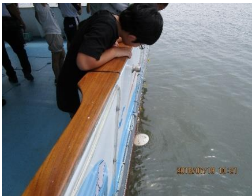
③体験型学習（透明度の測定）