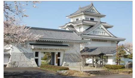
かすみがうら市歴史博物館全景