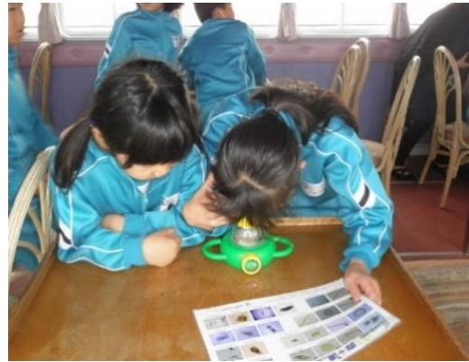
②体験型学習(プランクトンの観察)