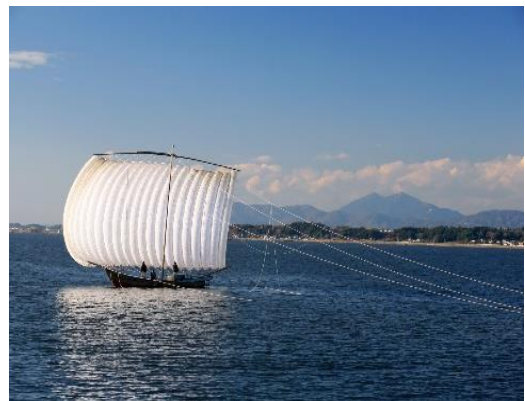
④湖内や湖岸状況の観察（イメージ）