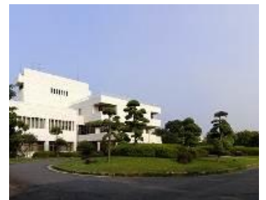
流域下水道事務所霞ヶ浦浄化センター