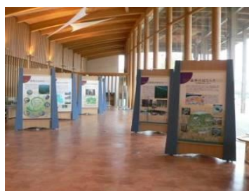
ビジターセンター