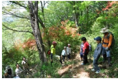
雪入ネイチャーウォーク