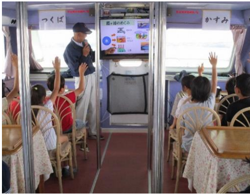
①霞ヶ浦に関するモニターでの説明