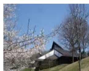
森のカルチャーセンター

森林、林業、野生鳥獣、木製玩具など、木材に関するさまざまな展示コーナーがあります。