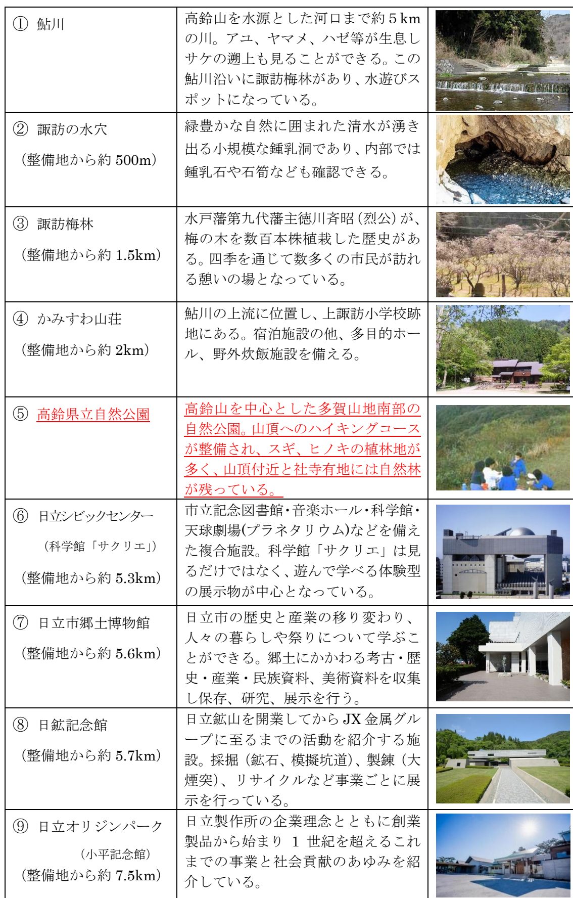
表 1.1 周辺地域資源の概要