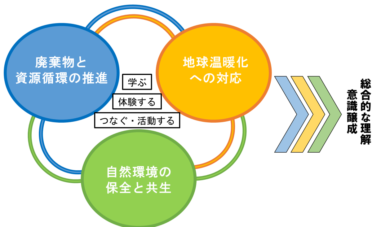
図1.2 学習テーマの展開イメージ