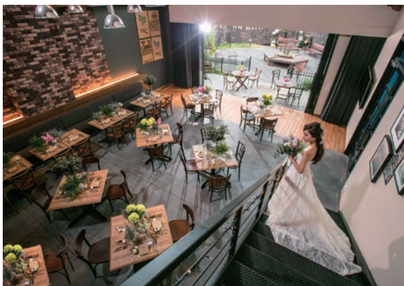
ウェディングレストランの外観・内観