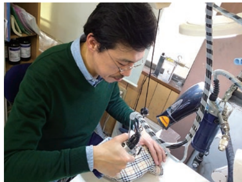
特殊シミ抜き作業の様子

今後は、外注対応となっている難洗濯品のクリーニング及び衣類のリペアの内製化を図る。