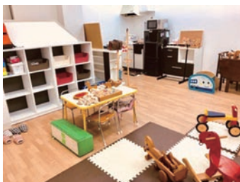
みっしえるキッズルーム(教室)