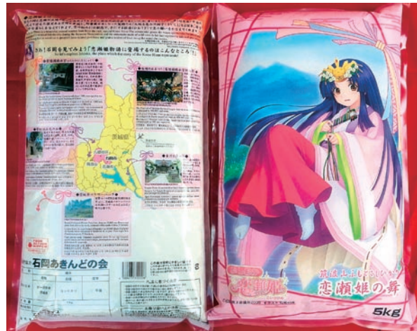
大ヒット商品となった恋瀬姫の舞

これらの影響により、現在では返礼品を中心に、年間7千件近い需要があり、当社を代表するヒット商品となっています。