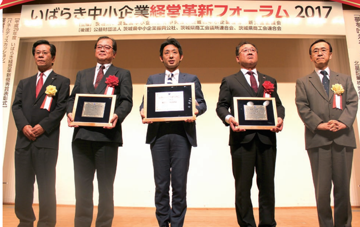
いばらき経営革新優秀賞表彰式（いばらき中小企業経営革新フォーラム2017）