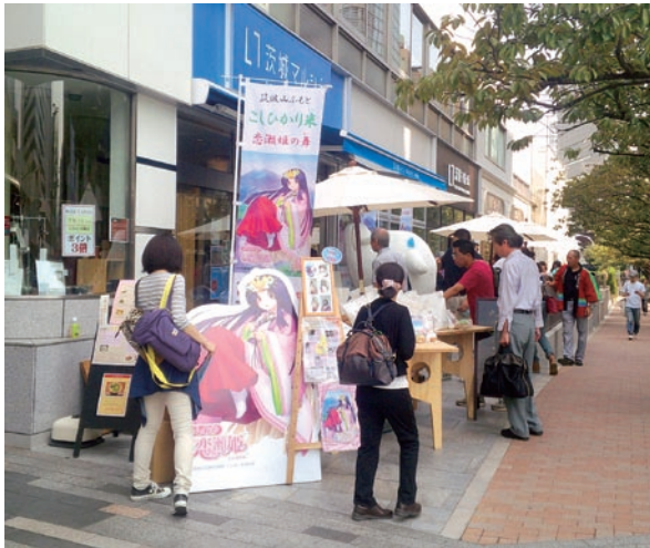
茨城マルシェでのイベントの様子

また、自社ホームページを新たに立ち上げ、インターネット販売を開始したほか、地元観光施設（常陸風土記の丘、県フラワーパーク等）の売店や直売所、ショッピングモールや交流施設、茨城マルシェ（東京・銀座の県アンテナショップ）等への卸販売など、店舗外での販売や各種イベントでのPRにも積極的に取り組みました。