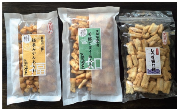
今回開発した地域限定商品