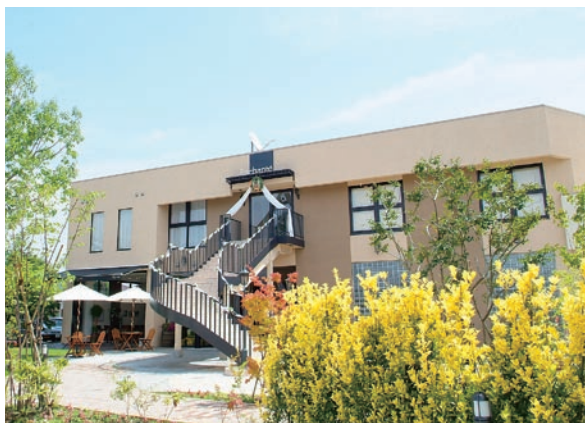
フォトウェディングショップ外観

ブライダル事業については、近年増加している少人数のカジュアルウェディング需要の取り込みを図るため、フォトウェディングショップ（挙式と写真撮影のみ提供）やドレスショップ、結婚式場紹介のセレクトショップ等を運営しており、本業の写真業と並ぶ収益事業となっています。