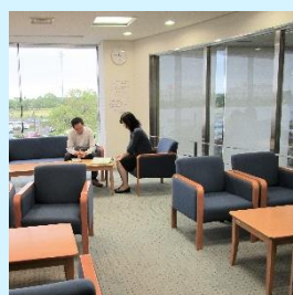
休憩可能なフリースペース