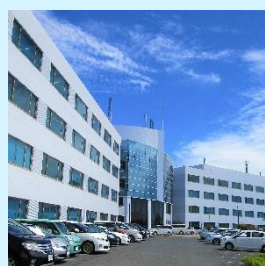
ひたちなかテクノセンター

事務職にかかせないOA操作についてOS基本操作からOffice系ソフトまでを体系的に学びMOS試験の合格を目指します。さらに事務職基礎知識(総務事務と社会保険の基礎)及び、Excelに関しては、基礎からマクロ・ExcelVBA (Excelプログラミング基礎) までを学習し「OA事務エキスパート」人材を目指します。