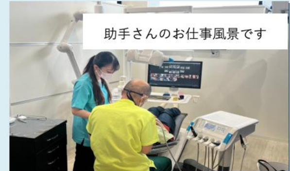
助手さんのお仕事風景です