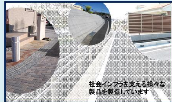
社会インフラを支える様々な製品を製造しています