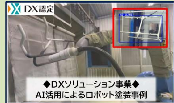
◆DXソリューション事業◆ AI活用によるロボット塗装事例