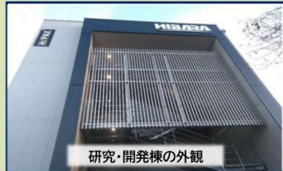
研究・開発棟の外観

また、当社は、柔軟な働き方やワークライフバランスの向上を図り、社員の多様なライフスタイルを尊重する「働き方改革」を積極的に推進しています。社員一人ひとりの成長と満足を支援すると共に、新たな時代の要求に応え、お客様の課題を共に解決し、持続可能な未来を築くことを当社の使命としています。皆様のご応募を心よりお待ちしております！