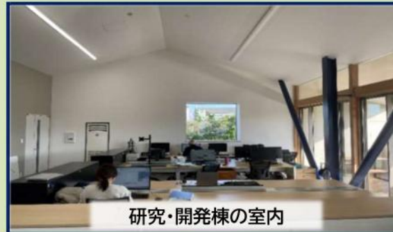
研究・開発棟の室内