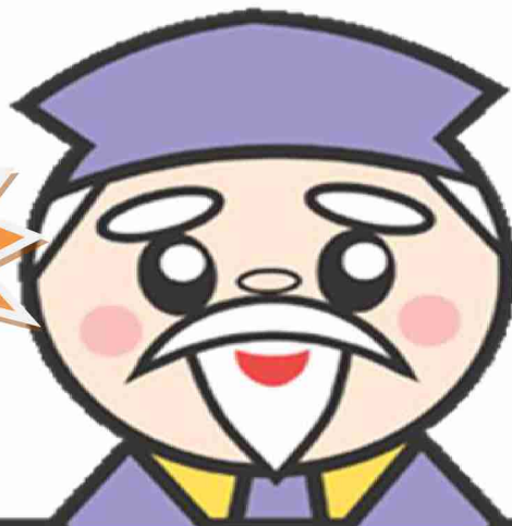
茨城県マスコット ハッスル黄門