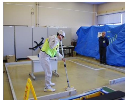
ビルクリーニング