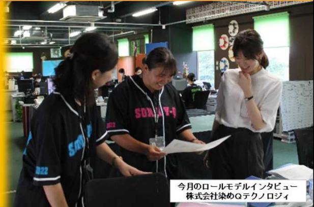
今月のロールモデルインタビュー 株式会社染めQテクノロジー