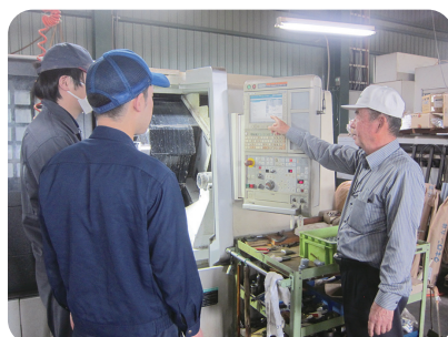
技能講習会（機械加工）