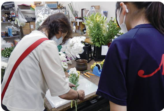
ジュニア技能インターンシップ(フラワー装飾)