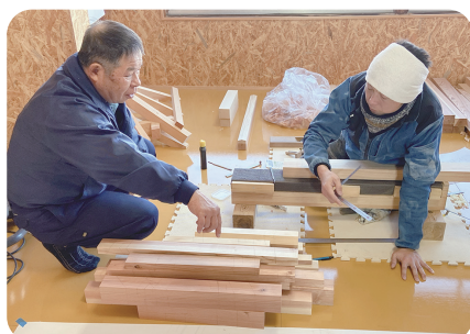
技能講習会（建築大工）