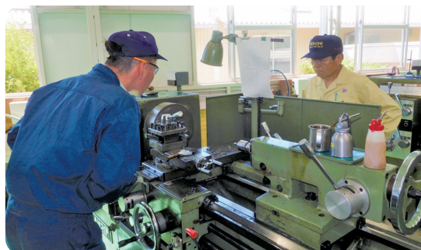
在職者訓練(普通旋盤)