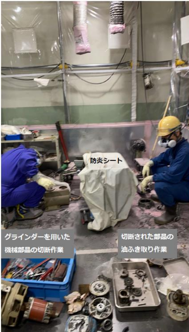
発災現場における現場作業の再現写真