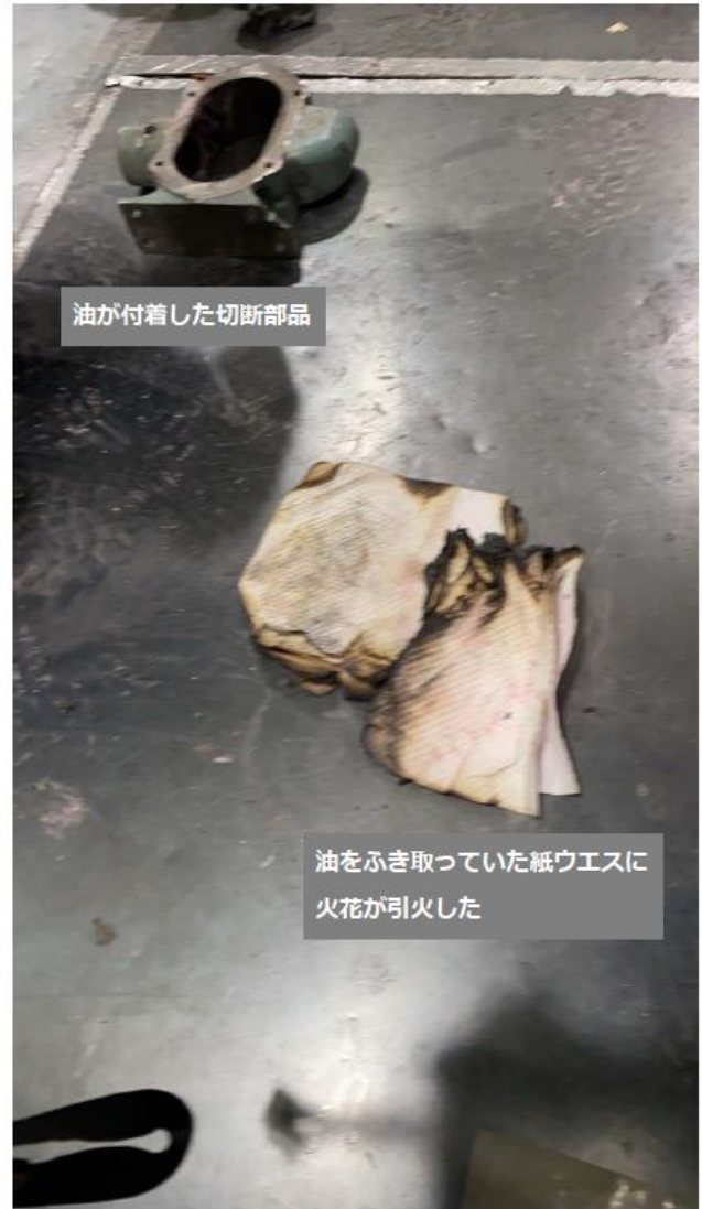
引火した紙ウエスと切断部品