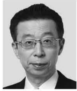
はまの よしふみ 浜野 よしふみ 参議院議員 現職 まっすぐに力強く! 働く仲間のために!