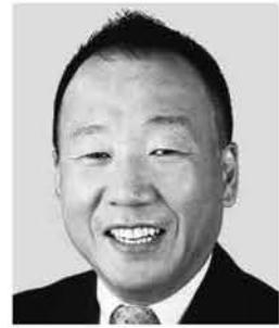
おしま くすお 大島 九州男 参議院議員 現職 平和憲法の精神を 守ります