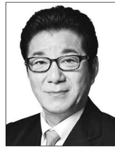
代表 松井 一郎