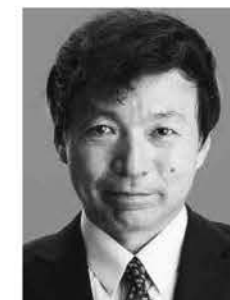
おいかわ ゆきひさ 外務局長