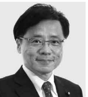
党参院幹事長・国対委員長 井上さとし 現 61歳。参院議員3期。 活動地域 東海、北陸信越、京都