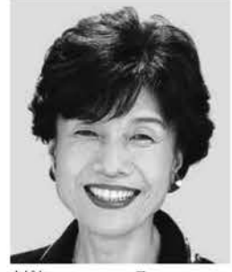
とまだ よりよ 円 より子 元参議院議員 元職 世直しおばあ、 子育て世代全力応援