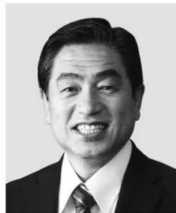
わかまつ 若松 かねしげ 現 役職:元復興副大臣。参院議員1期。 経歴:中央大学二部卒。公認会計士。 税理士。行政書士。 年齢:63歳 「現場第一」で復興・防災に全力