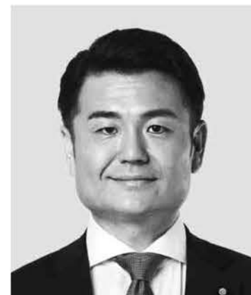
かわの よしとむ かの 義博 現 役職:党食品ロス削減推進 プロジェクトチーム事務局長。 参院議員1期。 経歴:慶應義塾大学経済学部卒。 年齢:41歳 近い。速い。温かい。

公明党は、参院選比例区に上記の6人をはじめ17人を公認しています。(順不同) ※年齢は公示日現在