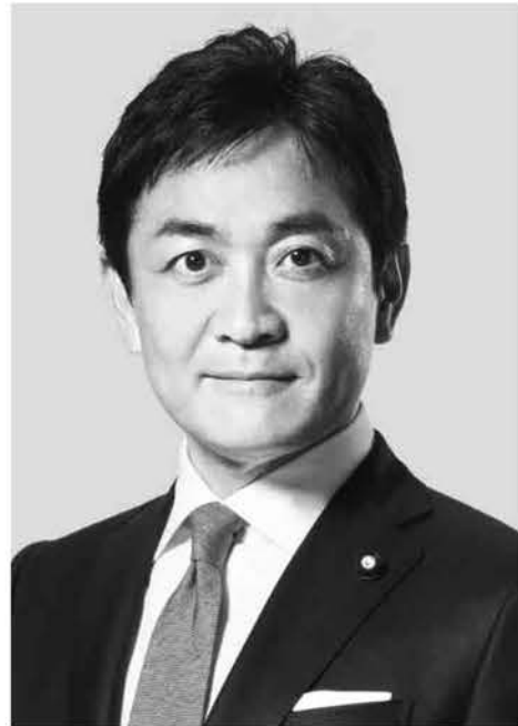
国民民主党 代表 玉木雄一郎