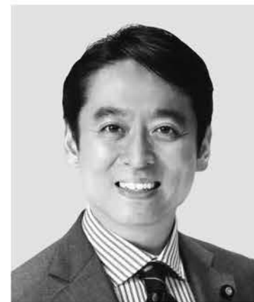
ひらき 平木 だいさく 現 役職:元経済産業大臣政務官。 参院議員1期。 経歴:東京大学法学部卒。 年齢:44歳 未来をひらく 確かな実力!