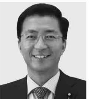
党副委員長 山下よしき 現 59歳。参院議員3期。 活動地域 大阪、兵庫、滋賀、奈良、和歌山