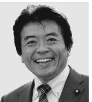
弁護士 仁比そうへい 現 55歳。参院議員2期。 党参院国対副委員長。 活動地域 中国、四国、九州・沖縄