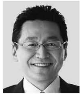
いそざき 哲史 参議院議員 現職 仲間の思い、 かたちにしたい。