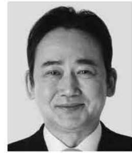
いしがみ 石上 としお 参議院議員 現職 全力で聴く。全力で届ける。 全力で挑む。