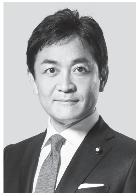
国民民主党 代表 玉木雄一郎