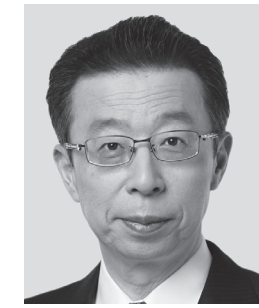
ほまの 浜野 よしふみ 参議院議員 現職 まっすぐに力強く! 働く仲間のために!