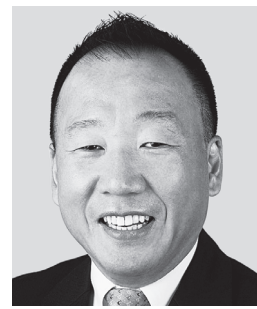
おおしま 大島 九州男 参議院議員 現職 平和憲法の精神を 守ります