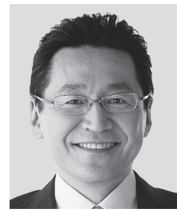
いそざき いそざき 哲史 参議院議員 現職 仲間の思い、 かたちにしたい。