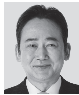
いしがみ 石上 としお 参議院議員 現職 全力で聴く。全力で届ける。 全力で挑む。