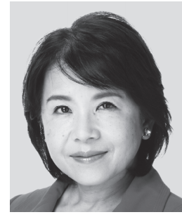
ひめい ひめい ゆみこ 司法書士・行政書士 元職 頑張る女性が 幸せになる社会へ!