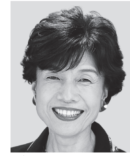
まる 円 より子 元参議院議員 元職 世直しおぼあ、 子育て世代全力応援