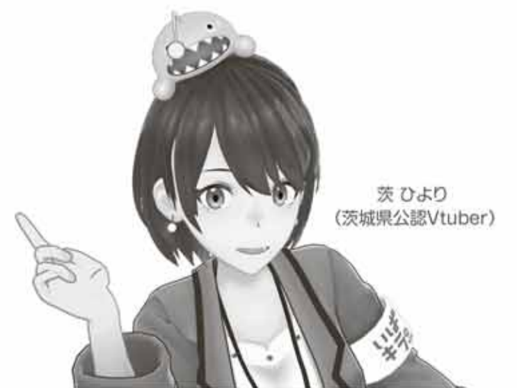
茨ひより (茨城県公認Vtuber)