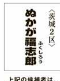
<茨城2区> めかが 福志郎 上記の候補者は、小選挙区のみ立候補のため、法令により顔写真の掲載ができません。