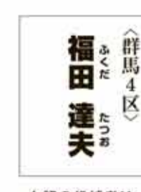
<群馬4区> 福田 達夫 上記の候補者は、小選挙区のみ立候補のため、法令により顔写真の掲載ができません。