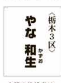
<栃木3区> やな 和生 上記の候補者は、小選挙区のみ立候補のため、法令により顔写真の掲載ができません。