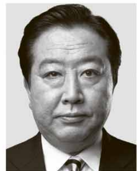
立憲民主党 代表 野田佳彦