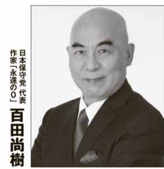
日本保守党代表 作家「永遠の0」 百田尚樹