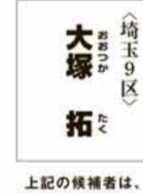
<埼玉9区> 大塚 拓 上記の候補者は、小選挙区のみ立候補のため、法令により顔写真の掲載ができません。