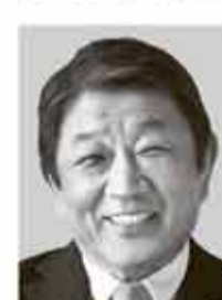
<栃木5区> 茂木 としみつ