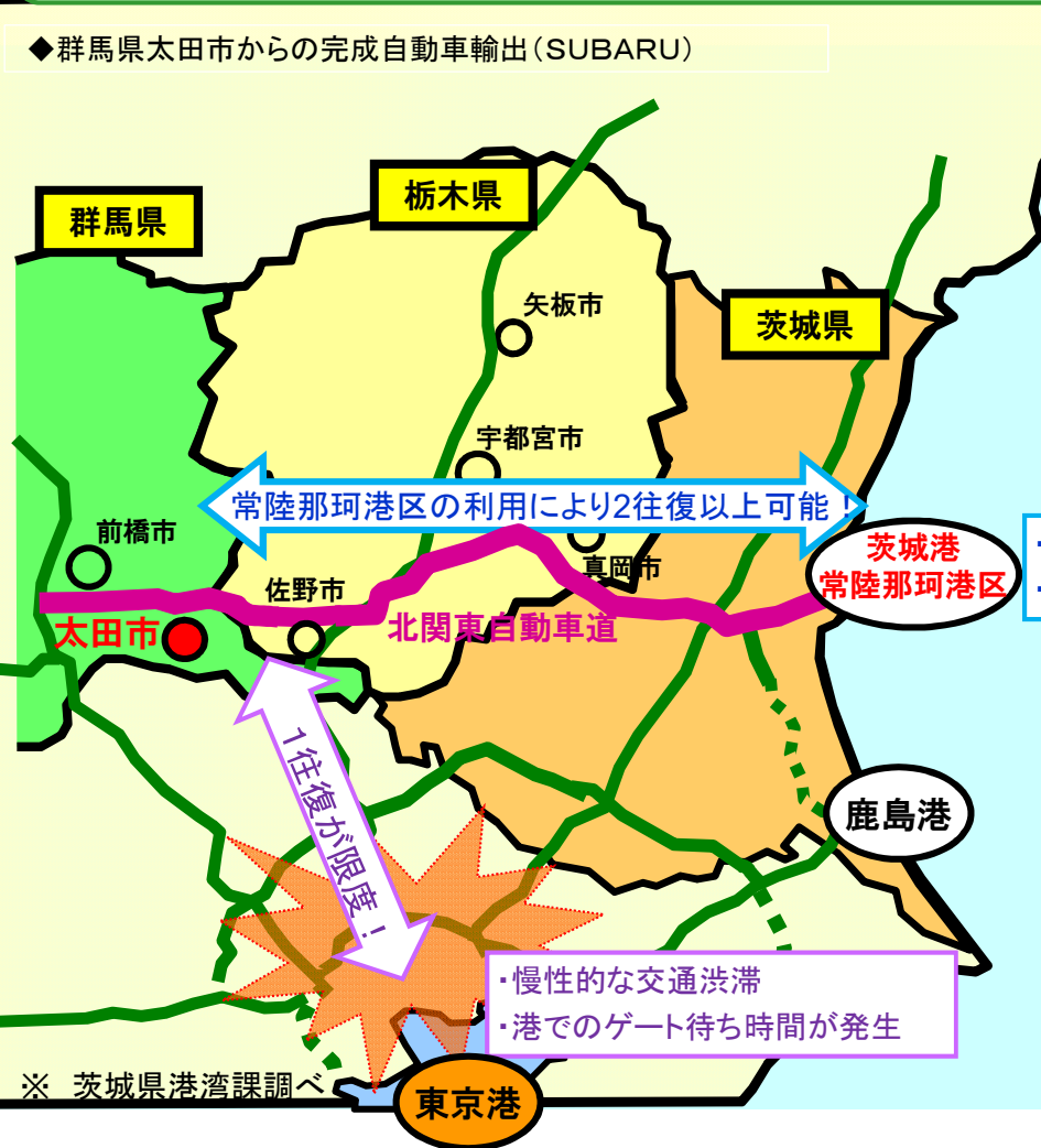
高速道路と直結する茨城港常陸那珂港区