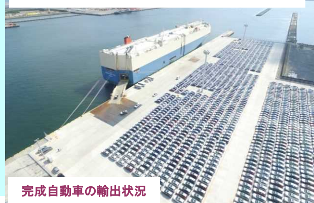
茨城港常陸那珂港区中央ふ頭地区水深12m岸壁