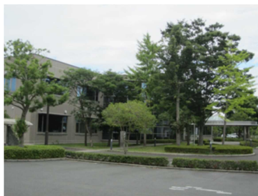
行方地域農業改良普及センター（行方合同庁舎 2F）