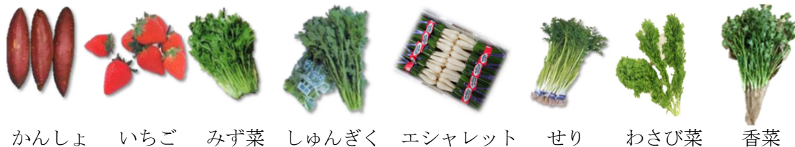
かんしょ いちご みず菜 しゅんぎく エシャレット セリ わさび菜 香菜